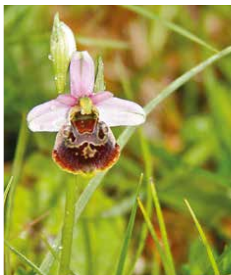
Ophrys bourdon.