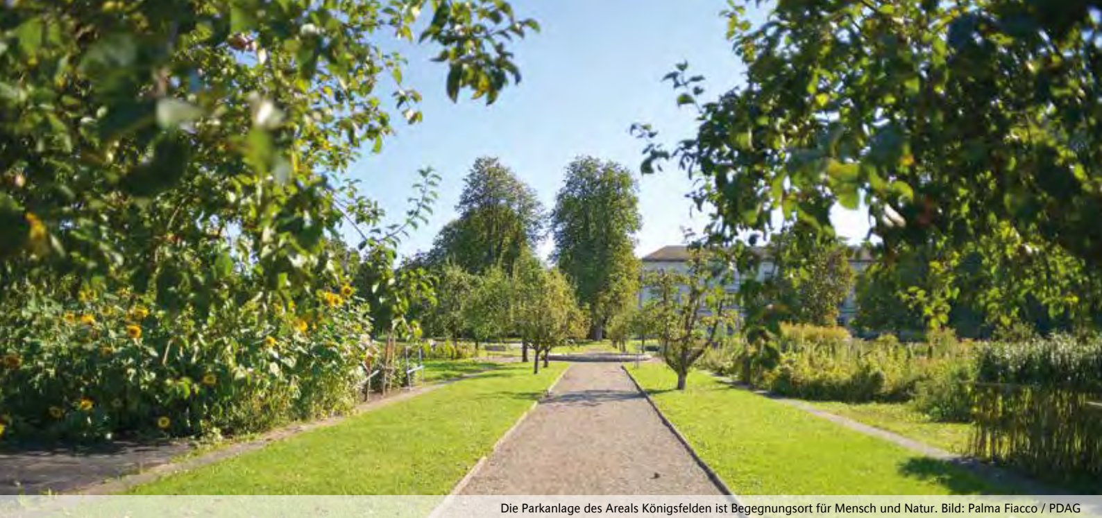
Die Parkanlage des Areals Königsfelden ist Begegnungsort für Mensch und Natur.