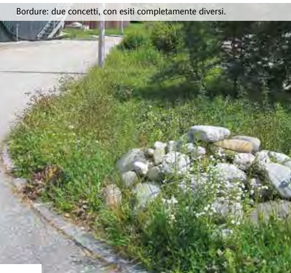
Bordure: due concetti, con esiti completamente diversi.