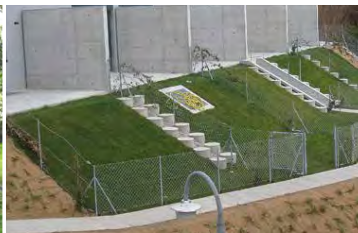
Due differenti mentalità: il variegato giardino naturale e il giardino artificioso, in cui non vi sono specie indigene e il prato è stato posato a rotoli (zolle).