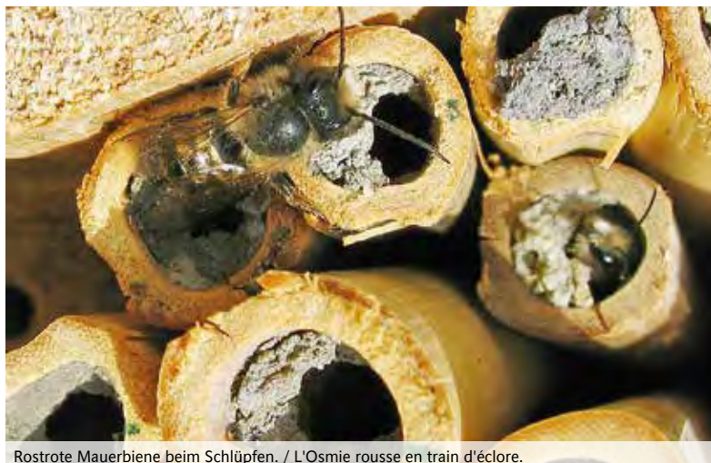
Rostrote Mauerbiene beim Schlüpfen. / L'Osmie rousse en train d'éclorre.