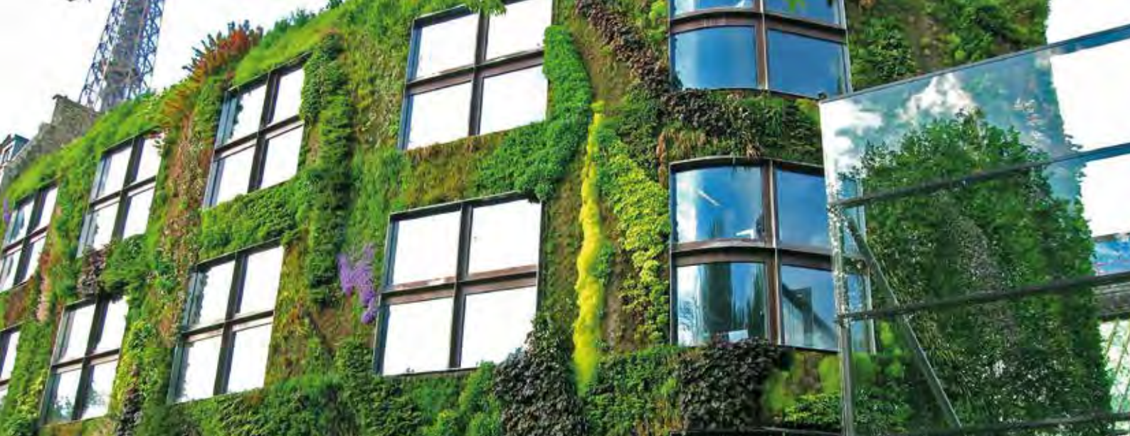
Musée du Quai Branly von Architekt Jean Nouvel (Bild: Patrick Blanc)