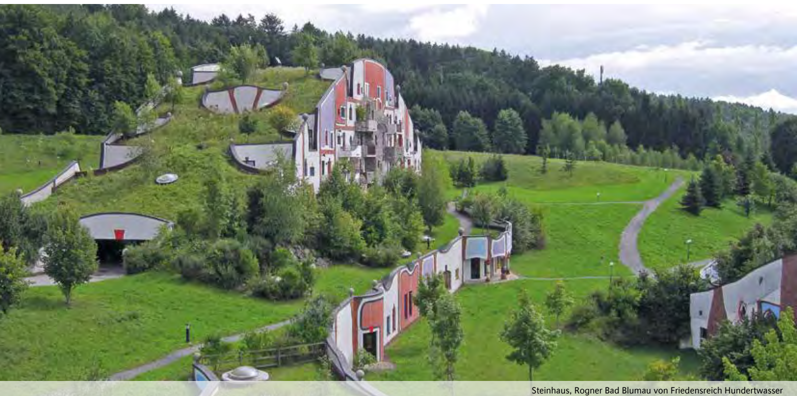
Steinhaus, Rogner Bad Blumau von Friedensreich Hundertwasser

L'idea di restituire sul tetto parte di quanto un edificio ha tolto alla natura risale a Friedensreich Hundertwasser. Un'idea che impegno e creatività possono far rivivere.