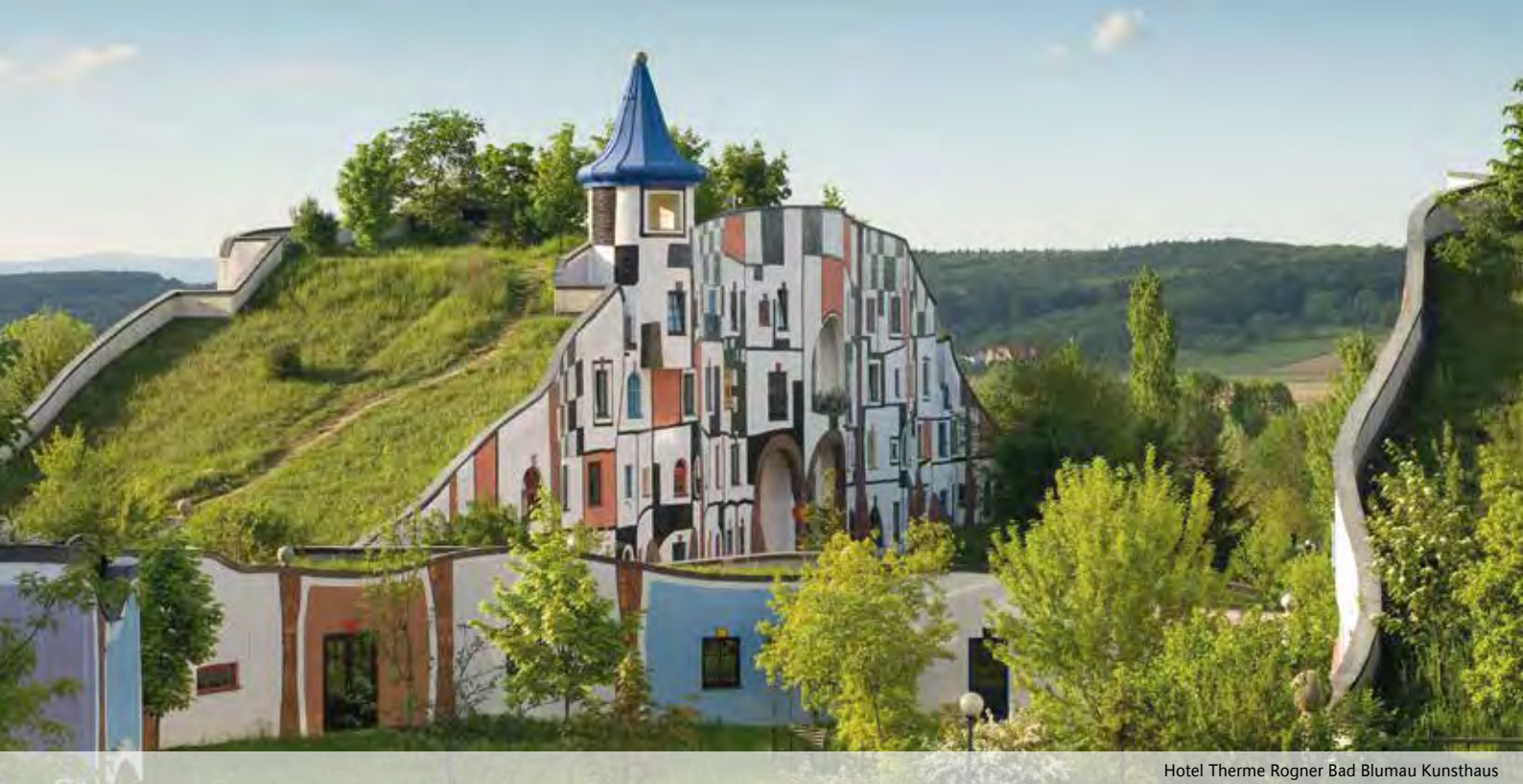
Hotel Terme Rogner Bad Blumau Kunsthaus