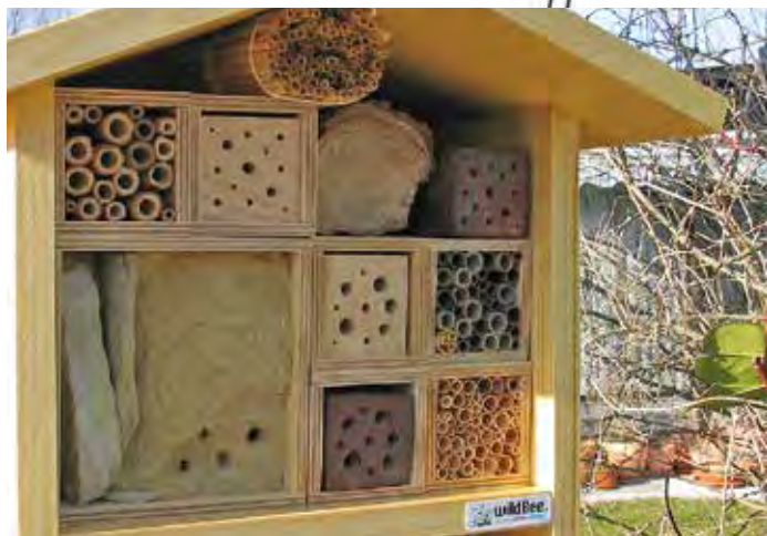
Nisthilfe / Nichoir à abeilles (hôtel à insectes).