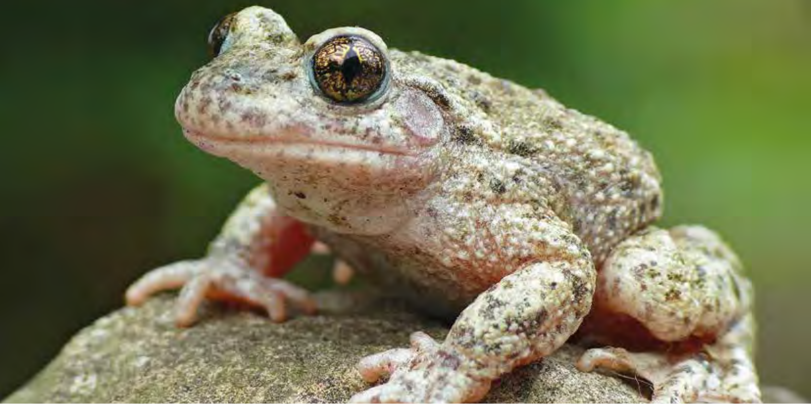
Golden schimmernde Augen: eine Auffälligkeit der stark gefährdeten Geburtshelferkröte (Tier des Jahres 2013).