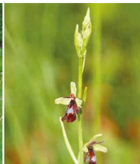
Ophrys mouche.