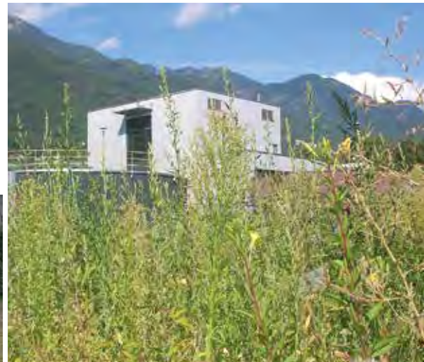
Industria immersa nel verde, spazi aziendali senza vita (la siepe addossata al muro è esotica).