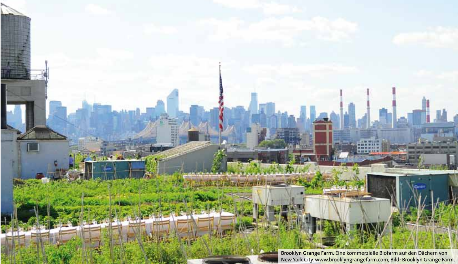
Brooklyn Grange Farm. Eine kommerzielle Biofarm auf den Dächern von New York City. www.brooklyngrangefarm.com , Bild: Brooklyn Grange Farm.

in der Zukunft möglich sein, wenn die nötige Technologie entwickelt ist, um beispielsweise auf Flachdächern landwirtschaftliche Produkte anzubauen. Die Geografin befasst sich seit längerem mit Urban Gardening und Stadtentwicklung. Für sie ist der Gemüseanbau in der Stadt in erster Linie eine politische Frage, nämlich die Frage nach der Nutzung und dem Wert städtischer Freiflächen. Speziell in den dicht gebauten Schweizer Städten seien die Landreserven knapp, so Jäggi. Freie Flächen seien oft Baulandreserven und werden meist in Form einer Zwischennutzung zum Beispiel durch Familiengärtner genutzt. Für Jäggi wäre deshalb gerade in der Schweiz die Diskussion um städtische Freiflächen wichtig. Wollen wir den Wert des Bodens anders bemessen als in Form potenziellen Baulandes? Wie könnte städtischer Nahrungsmittelanbau die Stadtentwicklung beeinflussen? Solche Fragen würden in Kanada, England oder Deutschland seit längerem untersucht und in die Stadtplanung mit einbezogen, erklärt Monika Jäggi. Wie sollen Aussenräume gestaltet werden, um Pflanzflächen zu ermöglichen? Wie Flachdächer oder Balkone? Ein weiterer Effekt der Urban Gardening Bewegung in der Schweiz und in Europa sei zudem, dass das Bewusstsein für die Herkunft von Nahrungsmitteln wachse und vermehrt gefragt werde, ob es wirklich Sinn macht, Lebensmittel vom anderen Ende der Welt heran zu