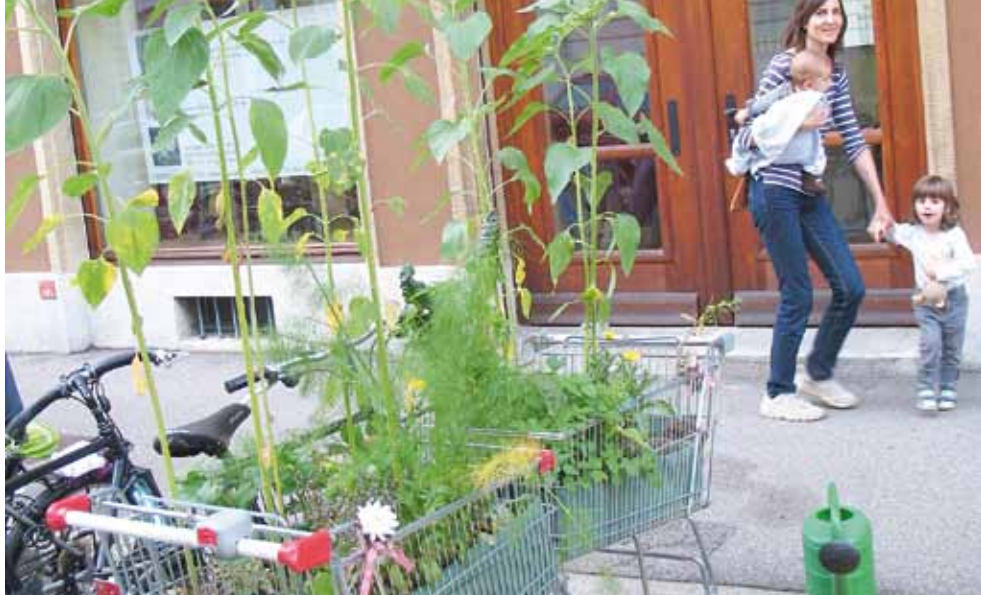
Keinkaufswagen. Ernten wo man isst. Baslerinnen und Basler bepflanzen Einkaufswagen mit Gemüse und Kräutern. www.keinkaufswagen.ch, Bild: Tilla Künzli.

questo, e adottare delle misure, fintanto che siamo in tempo. Dove e come produrre? Nelle aree dismesse, sui tetti, sui balconi? Le necessità legate tali colture potrebbe porre un diverso sviluppo urbanistico?