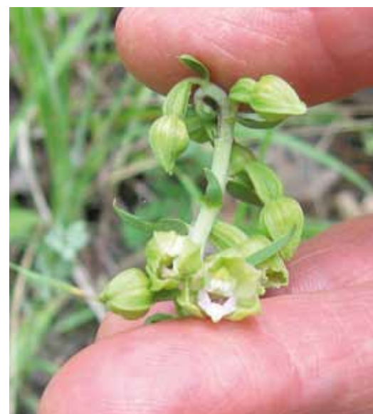
La discrétion de l'épipactis (une orchidée) contraste avec la carrure des infrastructures.