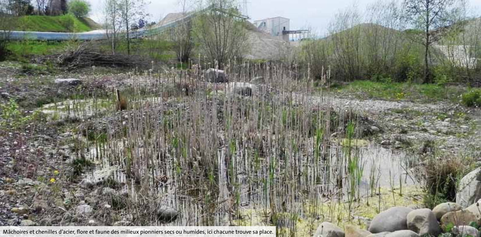
Mâchoires et chenilles d'acier, flore et faune des milieux pionniers secs ou humides, ici chacune trouve sa place.