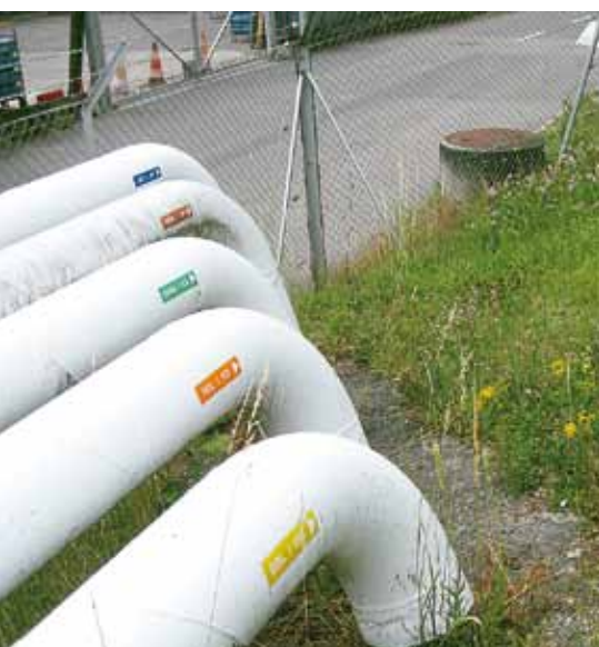
Jeu de cache-cache et de mimétisme des couleurs entre les tubes et les fleurs.