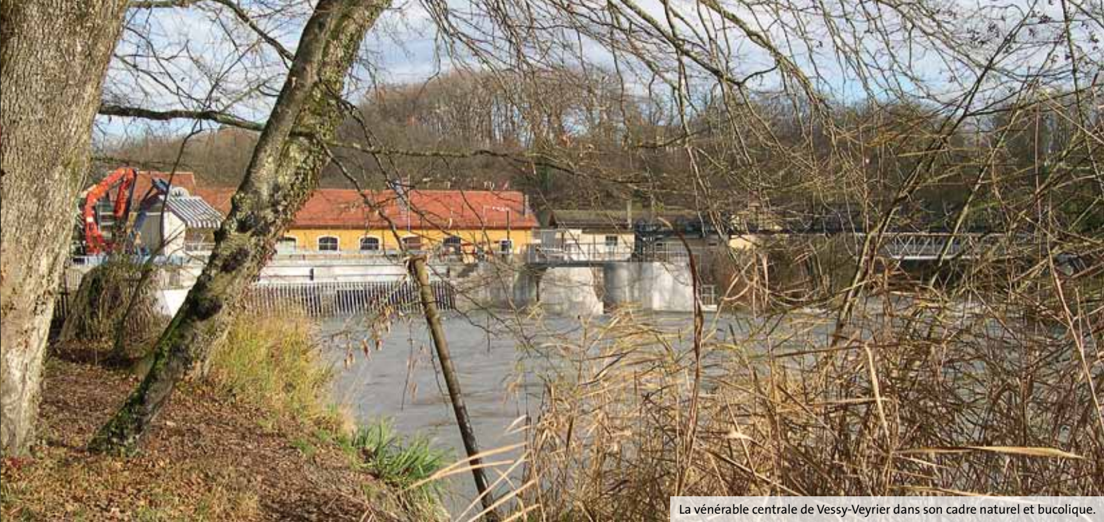
La vénérable centrale de Vessy-Veyrier dans son cadre naturel et bucolique.