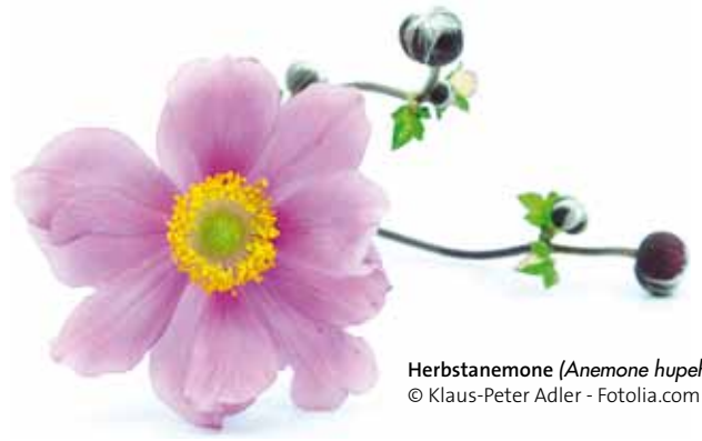
Herbstanemone ( Anemone hupehensis )

Envoyez-nous votre réponse à info@naturundwirtschaft.ch .