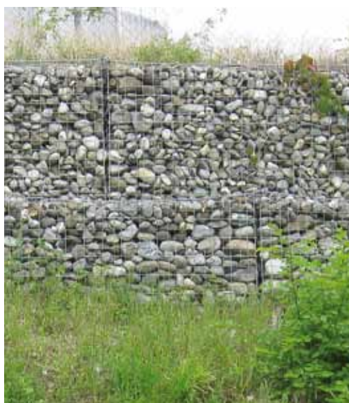
Gabions, talus maigre et buisson indigène : une bonne recette pour la biodiversité.