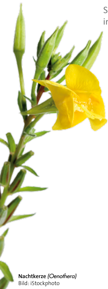
Nachtkerze ( Oenothera )

En tant que représentants de la Fondation Nature et Economie, nous ne comptons pas les plantes de jardins telles que les anémones parmi des plantes indigènes mais il n'est pas question non plus pour nous de les arracher! Des plates-bandes plantées d'anémones ne pourront donc pas être comptabilisées parmi les surfaces proches de l'état naturel, même si elles abritent également la barbe de bouc, qui fleurit en été, et qui est présente ici depuis des millénaires. Par contre, il s'agit impérativement d'arracher la vingtaine de néophytes mentionnées sur la liste noire, car leur prolifération peut entraîner de graves dégâts ou même des problèmes de santé publique.