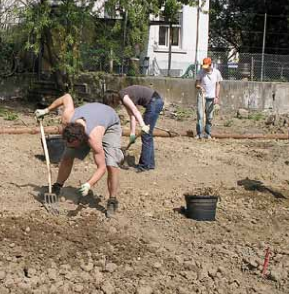
erich.ch, Bild: Grün Stadt Zürich.