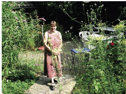
<< Das üppige Gründach der Walter Siefert AG in Pratteln BL. Le toit végétalisé luxuriant de la société Walter Siefert SA à Pratteln BL.