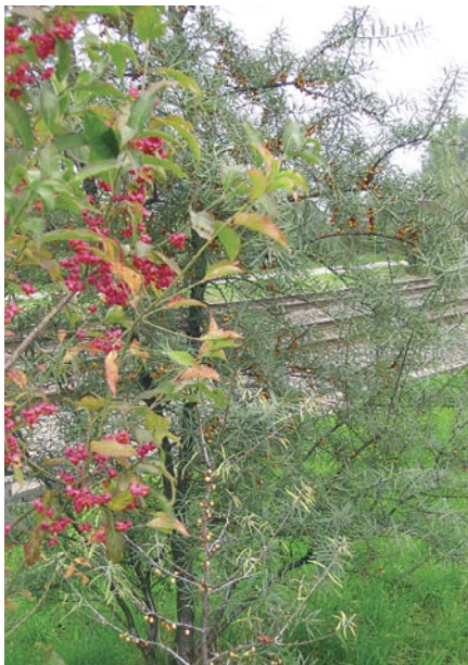
Pfaffenhütchen, Sanddorn & Co. verwandeln die öde Eisenbahnböschung in ein Naturkunstwerk; Naturpark Schweizer Paraplegikerzentrum, Nottwil. Fusains, argousiers et Cie transforment les talus des chemins de fer en chefs d'œuvre de la nature ; parc naturel du Centre suisse de paraplégiques, Nottwil

Für gestutzte Hecken eignen sich Kornelkirsche, Liguster, Weissdorn, Hainbuche, Buchs oder die immergrüne Eibe. Wer es bunter und abwechslungsreicher mag, kann aber auch eine Wildhecke pflanzen. Für kleine Gärten sind Niederheckenarten zu empfehlen, etwa Alpenjohannisbeeren, Buchsbaum, Sauerdorn, Pfaffenhütchen oder Heckenkirschen. Ob wild oder gestutzt: Dank einfallsreichen Hecken entstehen auf kleinstem Raum Lebensräume für Vögel und Schmetterlinge. Die Sträucher und Gehölze gliedern und strukturieren Firmenareale und Gärten, indem sie Nischen schaffen und schattige Sommerplätze. Die Hecken sind zudem wirksamer Sicht- und Lärmschutz.