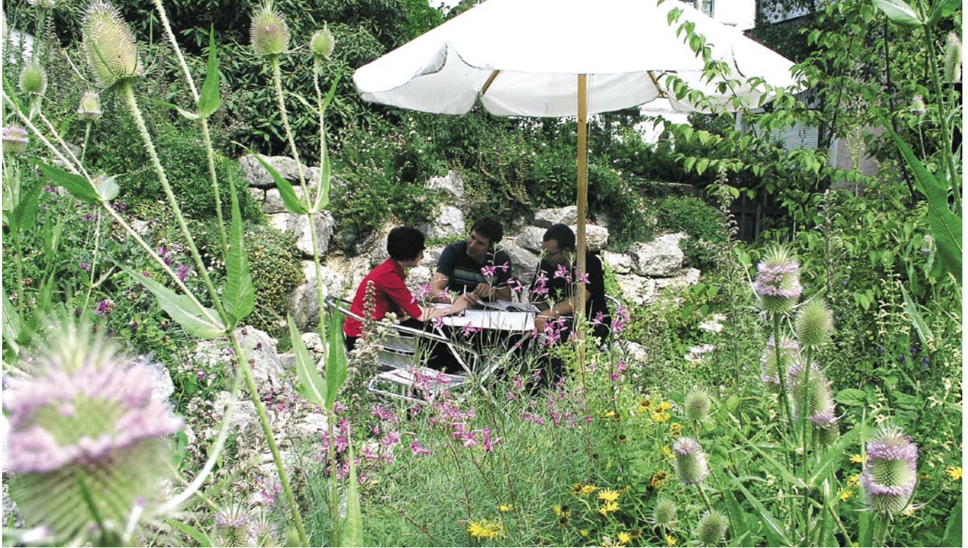
So macht Arbeiten Freude: Sitzung im Naturpark der Locher, Schmill, Van Wezemael & Partner AG in Basel.

Travailler ainsi fait plaisir: une séance dans le parc naturel de Locher, Schmill, Van Wezemael & Partner SA à Bâle.