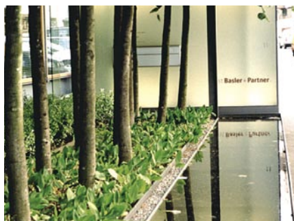
<< Das Biotop im 615 Quadratmeter grossen Naturpark des Ökobüros Hugentobler in Altstätten SG. Le biotope dans le parc naturel de 615 m 2 du bureau d'écologie Hugentobler à Altstätten SG.