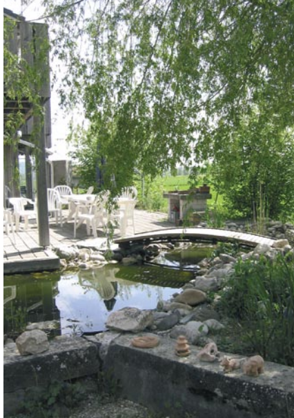
Aus Steinen geschaffen: Sitzplätze, Feuerstellen, Kieswege, Mauern und Uferböschungen; Naturpark Casa Fidelio, Niederbuchsiten SO. Créations en pierres: terrasses, foyers, allées de gravier, murs et bords d'étang ; parc naturel Casa Fidelio, Niederbuchsiten SO.