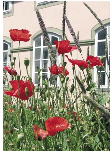
Ein einst steriler Rasenstreifen im Vorgarten ist heute ein sommerliches Blütenmeer. Un beau parterre de fleurs estivales a remplacé la pelouse stérile d'autrefois.

Wer über grosse Rasenflächen verfügt, kann einzelne Flecken umgraben und Sand und Kies unterpflügen. Im Frühling wird dann ein einheimisches Blumenwiesen-Saatgut ausgesät. Die Wiese, die so entsteht, wird zwei- bis dreimal pro Jahr geschnitten. Schon bald kann man die artenreicheren Wiesenstreifen nicht mehr von der übrigen Wiesenfläche unterscheiden. Jedes Jahr wird die Fläche in neuer Gräser- und Kräuterkombination erblühen. Rasenpfade, kleine Plätze oder ein Weglabyrinth verleihen der Wiese einen besonderen Reiz.