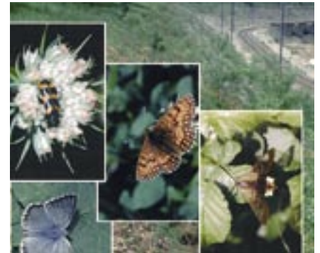
Werk Hüntwangen: Schmetterlinge Site de Hüntwangen : papillons