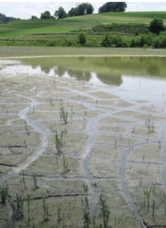
Werk Kirchberg: Absatzbecken und Ruderalflächen. Site de Kirchberg : bassin de décantation d'eau et surfaces rudérales.

Toutes les gravières de Holcim Granulats et Bétons SA ont déjà obtenu le certificat ISO 14001. Et déjà sept sur trente gravières de Holcim en Suisse ont obtenu le label « Parc Naturel ». Chaque site a son propre caractère et ses beautés naturelles particulières. Ils utilisent leurs ressources avec précaution et dans l'optique du développement durable. La remise en état après exploitation est planifiée de manière à ce qu'environ 15% des surfaces soient maintenues en surfaces écologiques de compensation.