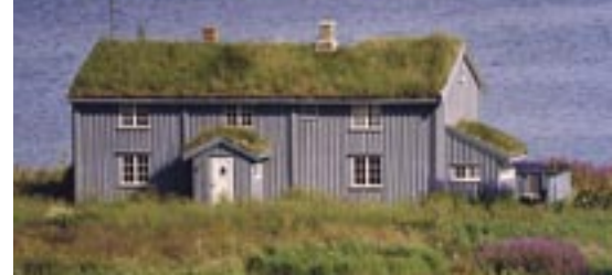
In Skandinavien hat die Dachbegrünung Tradition. En Scandinavie les toits végétalisés sont une tradition.

Auch viele Tierarten können begrünte Dachflächen erreichen und sich dort ansiedeln. Die fortschreitende Überbauung und der zunehmende Nutzungs-