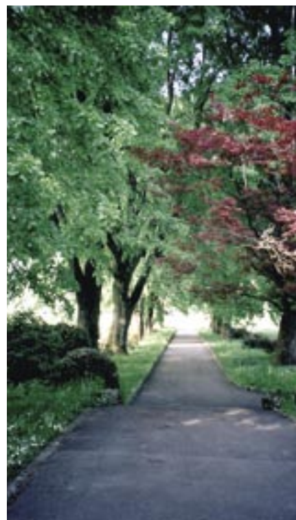
...im Naturpark des Berufsbildungsheims Neuhof in Birr (AG). Le parc naturel du centre de formation professionnelle Neuhof à Birr (AG).