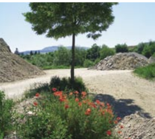
...aufgenommen von Martina Born im Naturpark der Samuel Amsler AG in Schinznach-Dorf (AG). Le parc naturel de la société Samuel Amsler SA à Schinznach-Dorf (AG), par Martina Born.

Le concours de photos lancé dans les communications 1/2005 en allemand a suscité un vif intérêt. Nous avons le plaisir de vous en présenter quelques-unes et souhaitons remercier cordialement tous les participants pour leurs envois !