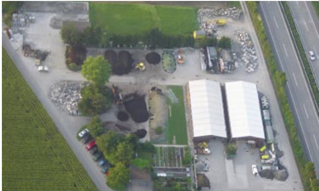
Der Werkhof aus der Vogelperspektive. Vue aérienne de l'entreprise.

und seither kommen versiegelte Beläge nur noch in stark befahrenen und beanspruchten Zonen zum Einsatz; auf den Parkplätzen und im Materiallager hingegen lassen Beläge wie Sickersteine oder Mergel das Regenwasser natürlich versickern. Die Niederschläge, die sich auf den Leichtbauhallen sammeln, gelangen über Sickergruben ins Grundwasser, das Wasser der begrüntten Flachdächer fliesst über eine Sicker Galerie und Sickerschächte zurück in den Boden.