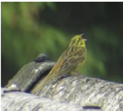
Singende Goldammer auf dem Dach der Fuhrer AG. Un Bruant jaune chante sur le toit d'un bâtiment de Fuhrer SA

Seit der Gründung des Gartenbaubetriebes 1952 wurde der Werkhof laufend den veränderten Bedürfnissen angepasst. 2001 wurde das Areal als «Naturpark der Wirtschaft» zertifiziert