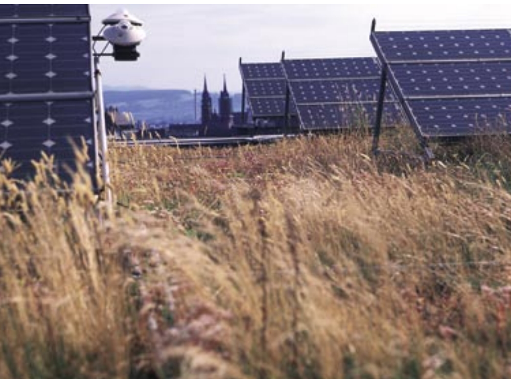
Ein Flachdach – drei Nutzungen: Energieerzeugung, Isolation und Bereitstellung einer Naturfläche hoch über dem Boden! Un toit plat – trois utilisations : production d'énergie, isolation et mise à disposition d'une surface naturelle au-dessus du sol !

Stephan Brenneisen, Hochschule Wädenswil