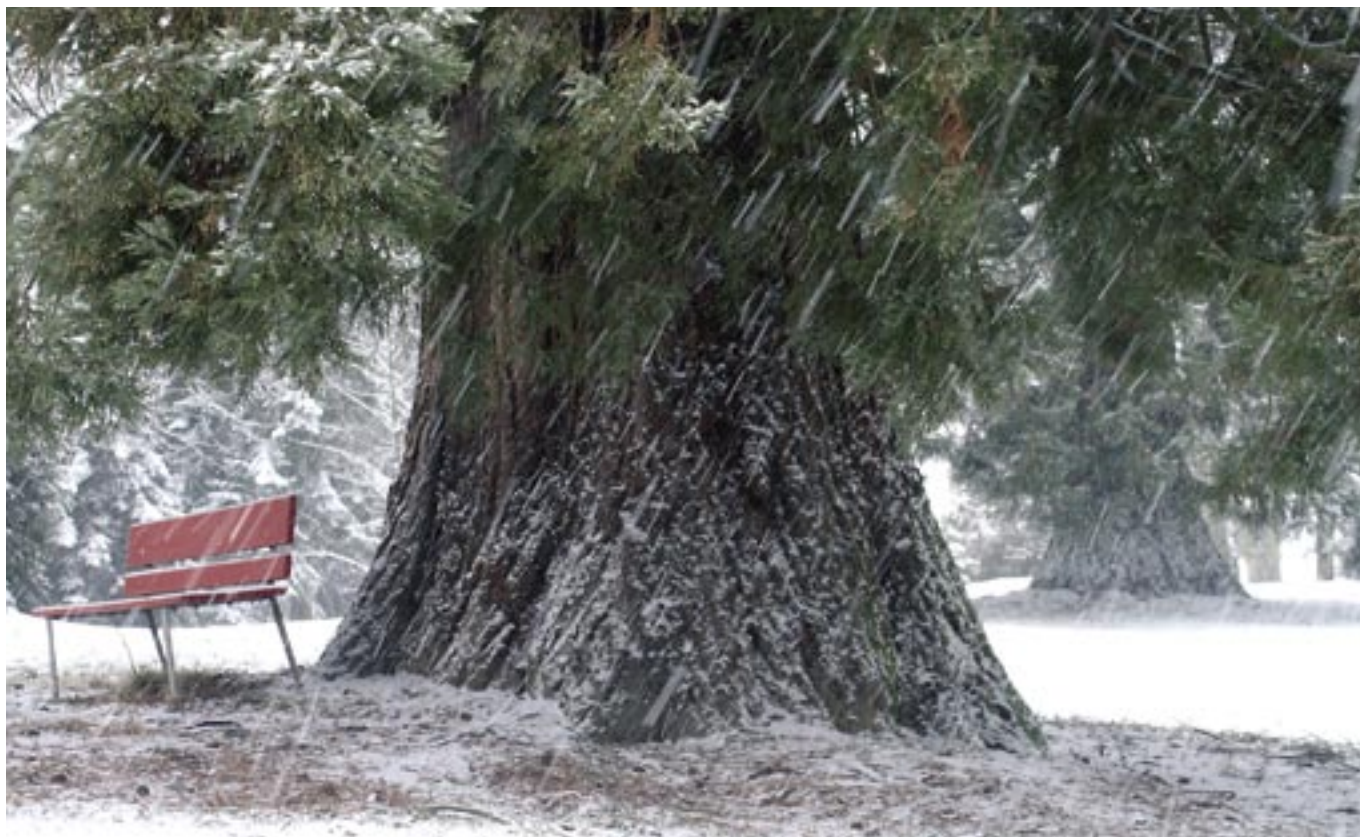
...aufgenommen von Martin Reber im Naturpark der Klinik Sonnenhalde in Riehen (BS). Le parc naturel de la clinique Sonnenhalde à Riehen (BS), par Martin Reber.

Der Foto-Wettbewerb im Newsletter 1/2005 stiess auf grosses Interesse. Wir können hier nur eine kleine Auswahl der tollen Naturpark-Bilder veröffentlichen, möchten uns aber bei allen Fotografinnen und Fotografen herzlich bedanken!