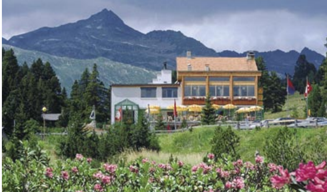
Il Centro Ecologico immerso nei rododendri. Ökologisches Zentrum inmitten von Alpenrosen!