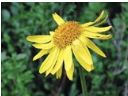
Arnika gehört zu den ältesten Heilpflanzen in Europa.

Kurskosten: Fr. 90.-, inkl. Kursunterlagen