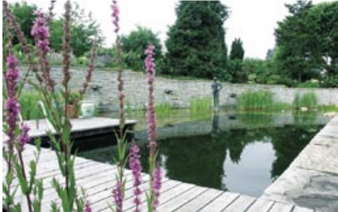
Ein von Winkler&Richard gebauter Schwimmteich.