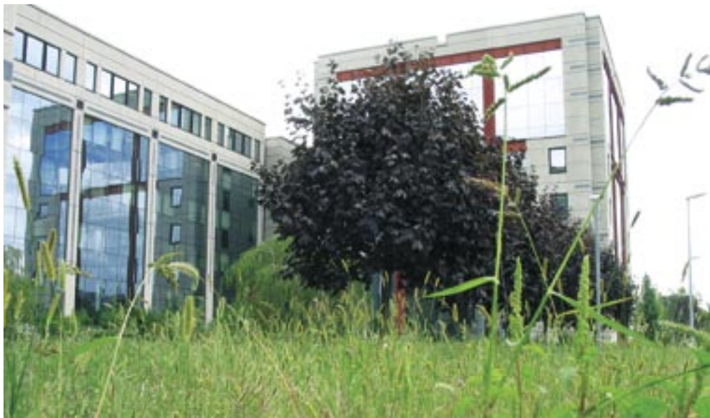
Une pelouse fleurie a remplacé avantageusement une partie des gazons. Eine Blumenwiese ersetzt heute vorteilhaft einen Teil des Rasens.

Le site du Lignon abrite plus de 1000 collaborateurs/trices. En tant que centre administratif, il représente également la vitrine publique de l'entreprise. Les travaux de réaménagement des espaces extérieurs étant nécessaires, les responsables ont rapidement été convaincus de l'intérêt de réaliser des aménagements extérieurs plus écologiques. Les résultats spectaculaires ont ensuite permis de convaincre de nombreuses personnes travaillant sur le site des avantages, par exemple, d'une pelouse fleurie par rapport à un gazon stérile : en l'espace de quelques mois, en milieu urbain, les oiseaux ont amené de la vie autour des immeubles, attirés par les nombreux insectes, eux-mêmes favorisés par un milieu plus naturel. Le gazonnement soudain des oiseaux à l'en-