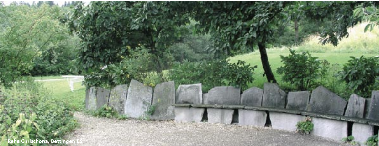
Reha Chrischona, Bettingen BS

Naturpark-Fotos auf CD oder als Papierkopie mit Angabe Ihrer Adresse bis 15. Juni 2005 einse- nden an: