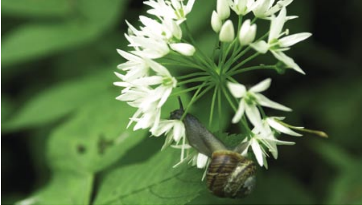
Bärlauch riecht gut, sieht schön aus und schmeckt erst noch. Und dies nicht nur uns Menschen...