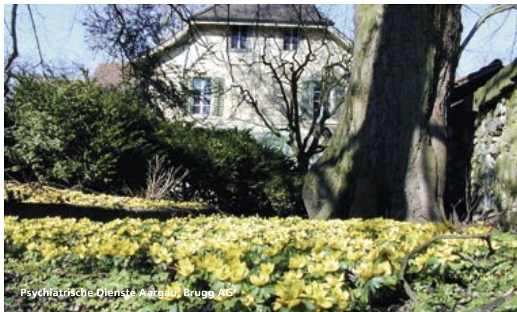
Psychiatrische Dienste Aargau, Brugg AG

Stiftung Natur&Wirtschaft Sälihalde 21 6005 Luzern