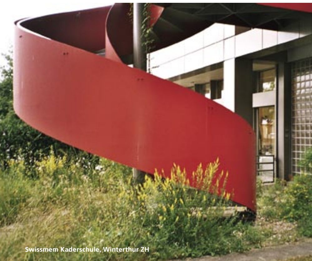
Swissmem Kaderschule, Winterthur ZH

...und senden Sie uns Ihre eigenen Naturpark-Fotos zu.