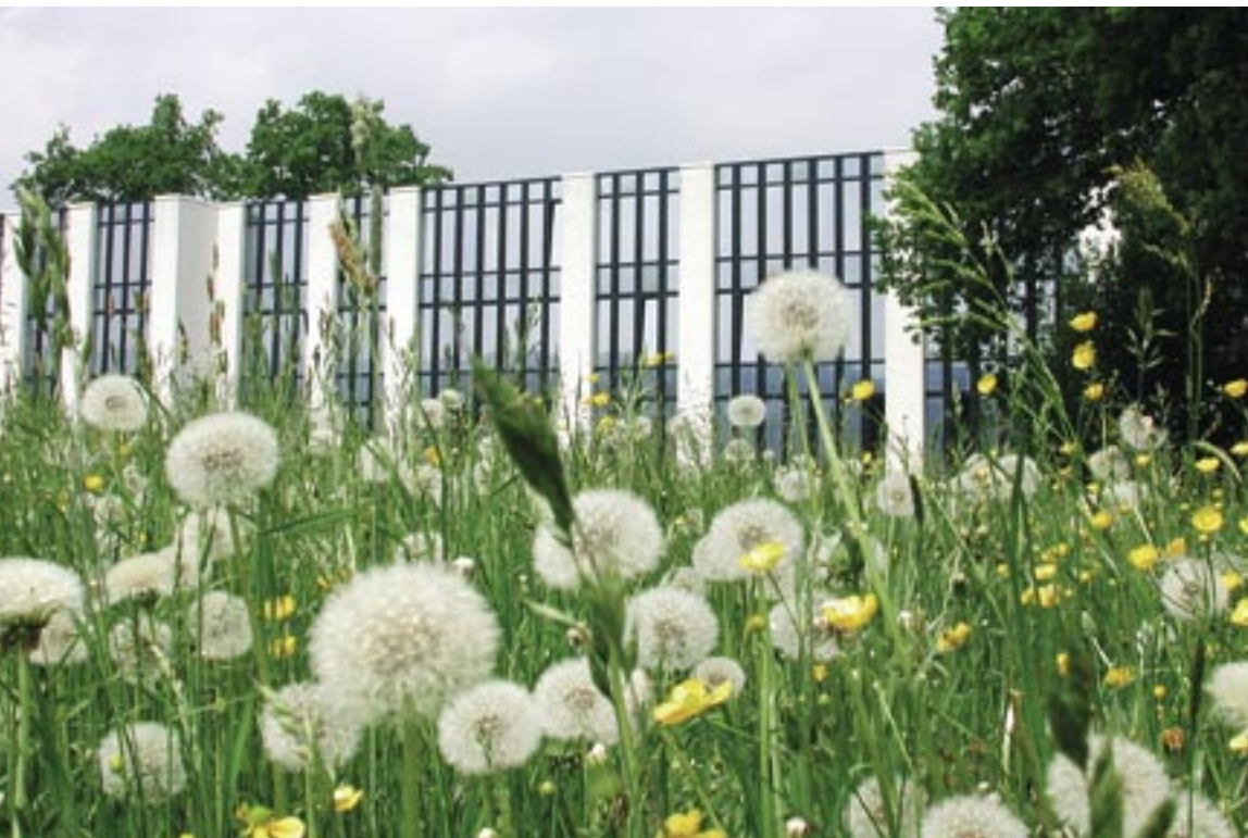
Erholsam: Die Angestellten der Collano können direkt vom Arbeitsplatz aus den Blick über die Blumenwiesen und in die Alpen schweifen lassen.

Der 15'800 Quadratmeter grosse Naturpark beherbergt auch einen Lehrpfad: Zehn Infotafeln informieren von der «Ruderalfläche» bis hin zur «Trockensteinmauer» und weitere 25 Botaniktafeln stellen einheimische Pflanzen vor. Der Collano-Lehrpfad ist teilweise öffentlich und Bestandteil des Naturlehrpfads Neuenkirch. Nicht nur für Kunden, sondern auch für Vereine und Schulen werden Naturpark-Führungen organisiert – die ideale Ergänzung zur Führung durch die Fabrik.