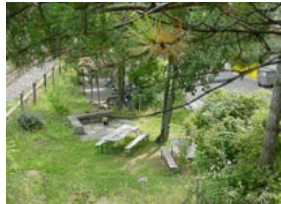
Zwischen Schiene und Werkareal liegt der Picknickplatz für die SIG-Mitarbeitenden in Neuhausen SH.

Weitere Informationen: thomas.burkhardt@sig.biz www.sig-id.ch