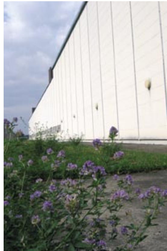
Blumenwiesen schmiegen sich an die Werkhallen in Beringen SH.