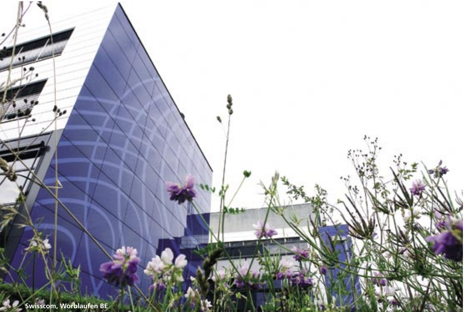
Swisscom, Worblaufen BE