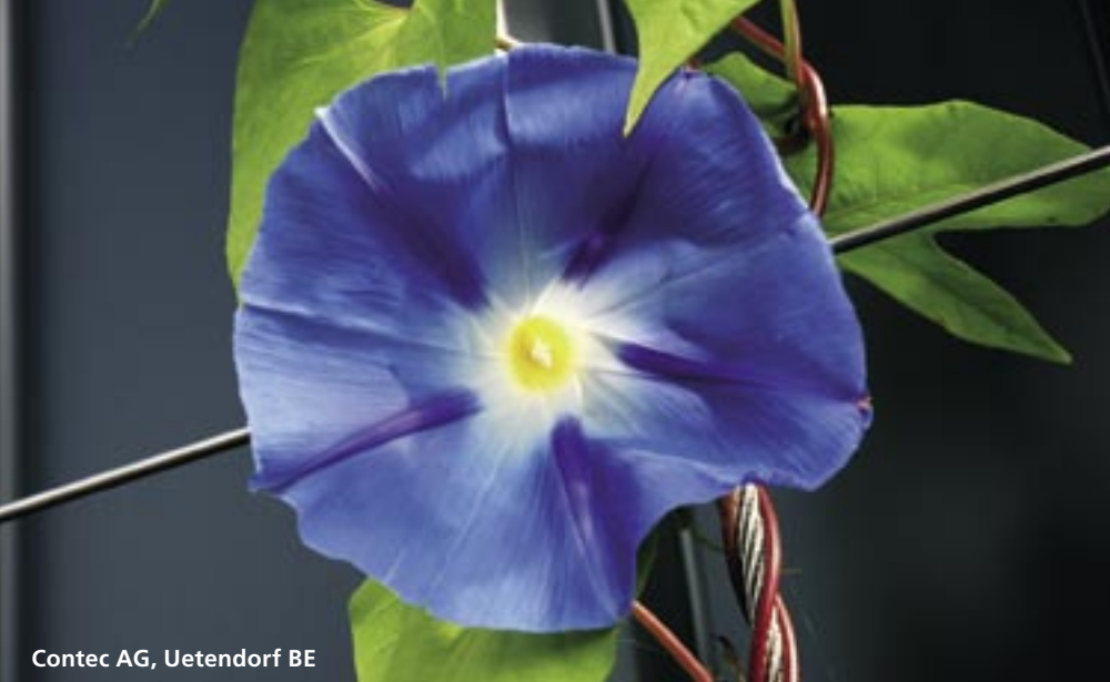
Contec AG, Uetendorf BE