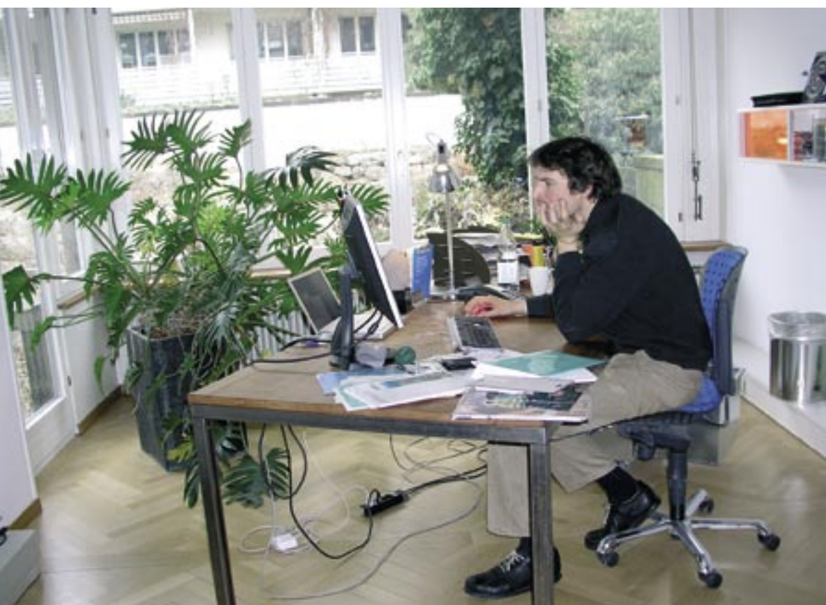
Grün am Arbeitsplatz verbessert das Raumklima, wirkt beruhigend und konzentrationsfördernd.