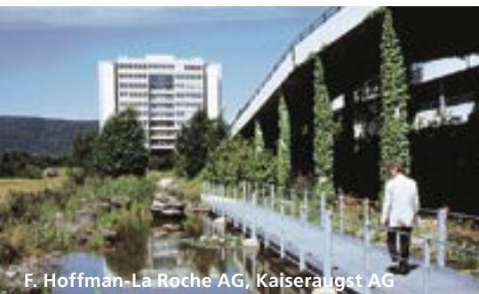
F. Hoffman-La Roche AG, Kaiseraugst AG