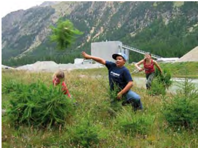
Schüler im Einsatz im Kieswerk Montebello in Pontresina. Des écoliers s'activent dans la gravière de Montebello, à Pontresina. Scolari all'azione nella cava Montebello a Pontresina

Ich besuche Kies-Abbaustellen, um Antragsdossiers für ein Zertifikat der Stiftung Natur & Wirtschaft zu erstellen. Bei meinem jeweils ersten Zusammentreffen mit den Maschinisten sind Freundlichkeit und Offenheit noch weit weg. Doch in den folgenden Gesprächen werden Befürchtungen abgelegt und die Basis für die zukünftige Zusammenarbeit geschaffen. Bis das Antragsdossier steht, führe ich auch noch Gespräche mit lokalen Naturkennern und kantonalen Behörden, sichte Inventare und recherchiere vor Ort.