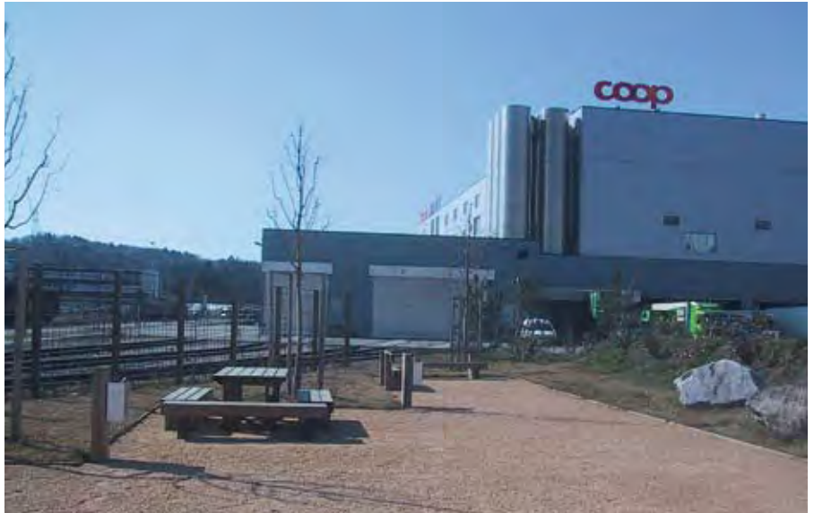
Coop Verteilzentrum in Aclens Centre logistique Coop à Aclens Centro di distribuzione a Aclens

Si de vastes surfaces sont couvertes de bitume en raison du trafic de poids lourds, les espaces verts ont été réalisés de manière à favoriser la flore et la faune indigènes. Environ 120 mètres de haies vives ont été plantés, avec notamment des églantiers, des épines noires, des merisiers à grappe ou encore des fusains. Aucun gazon n'entoure le centre logistique, mais seulement des prairies et des talus ensemencés avec des mélanges pour prairies fleuries et prairies maigres. Des tas de pierres ont été disposés en quelques places pour offrir des abris à la petite faune.