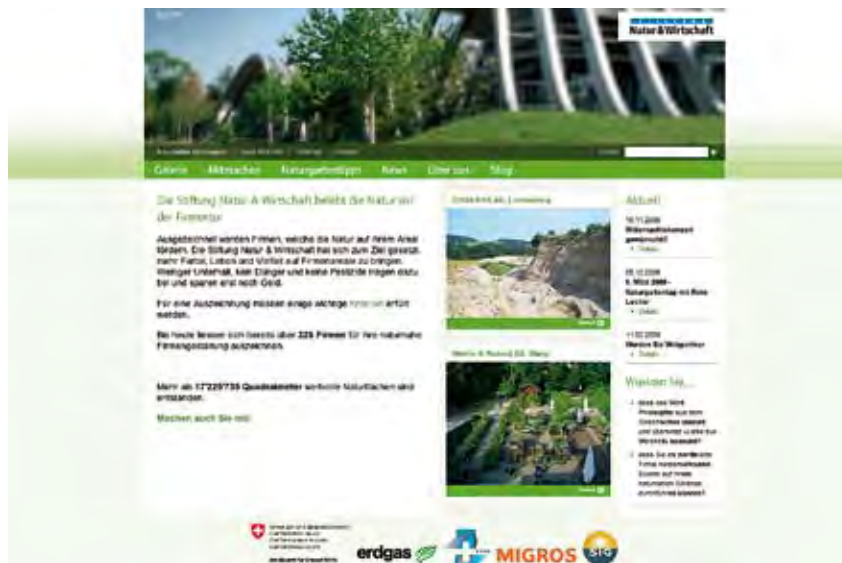
Die neue Webseite der Stiftung Natur & Wirtschaft: erfrischend und übersichtlich Fraîcheur, clarté et naturel pour notre nouveau site internet Il nuovo portale web: piacevole, spontaneo, chiaro

Unsere Stiftung hat laufend Neuigkeiten zu bieten. Diese finden Sie im News-Bereich: Informationen zu aktuellen Anlässen und das News-Archiv. Aber auch den Mediencorner finden Sie hier mit