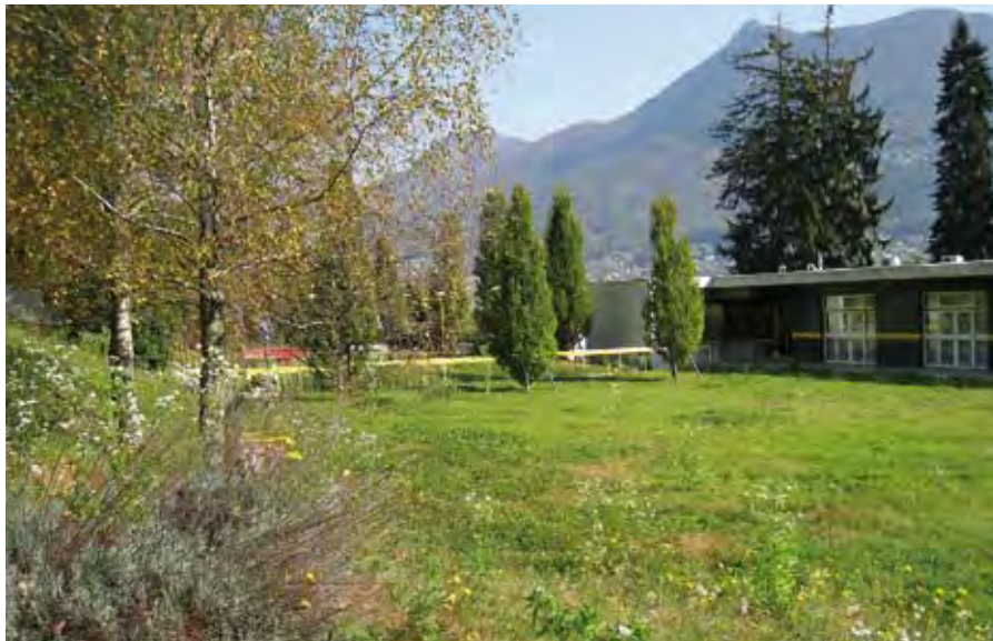
Il giardino della Casa dei ciechi, che gli ospiti hanno battezzato «Oasi dell'essere a casa!» Das Blindenheim in Lugano: Die Bewohner haben das Areal «Oase des Daheimseins» getauft. Le jardin du Centre pour aveugles est une oasis où les résidents se sentent comme à la maison.

cio nella natura, e viceversa. Notevole sottolineare che presso l'Accademia è stato certificato il primo tetto verde. Il settore del verde pensile deve essere maggiormente sostenuto e sperimentato, già solo perché offre immagini stupende.