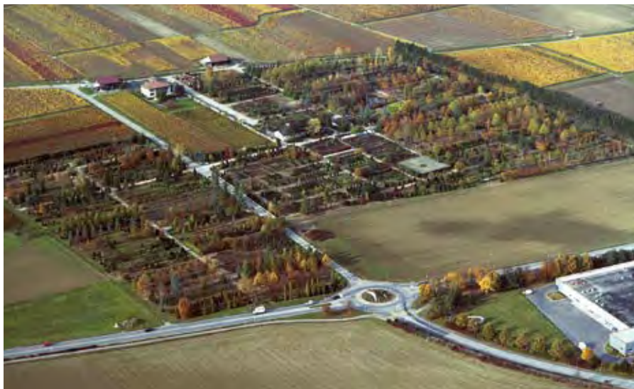
La pépinière Jacquet, où 53 espèces d'oiseaux ont été recensées. In der Baumschule Jacquet wurden bisher 53 Vogelarten entdeckt. Nel vivaio Jacquet sono state osservate 53 specie di uccelli.