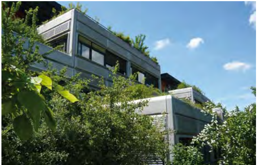
L'EPFL à Ecublens, tels les jardins suspendus de Babylone.

Et la gestion d'un si vaste site n'est pas chose aisée ; c'est en effet une véritable ville, avec plus de 10 000 étudiants, employés et professeurs. Heureusement que les responsables ont une vision non seulement très verte, mais aussi pragmatique, pour garder la vue d'ensemble et réaliser au besoin les mesures correctives permettant d'accroître la valeur de tel ou tel aménagement extérieur. Dès la 1 re certification en 2002, les responsables du site ont cherché à réduire les dépenses